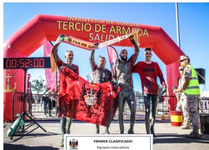
PRIMER CLASIFICADO Equipos masculinos EQUIPO TERCIO DE ARMADA IV EDICIÓN FANPIN 2019 - Tiempo: 52m 00s