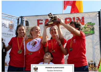
PRIMER CLASIFICADO Equipos femeninos EQUIPO TERCIO DE ARMADA III EDICIÓN FAN PIN 2018 - Tiempo: 1h 35m 01s